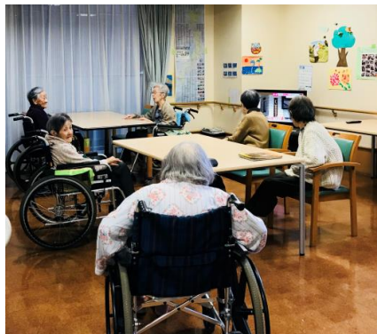
写真1. ロボット使用前の様子

しかしながら職員が来て隣に座ると、パロを抱いたり、撫でたりしながら、嬉しそうに職員と話を始めた。この光景は、高齢者ばかりでなく、職員にとっても幸せな時間のように映った（写真2）。